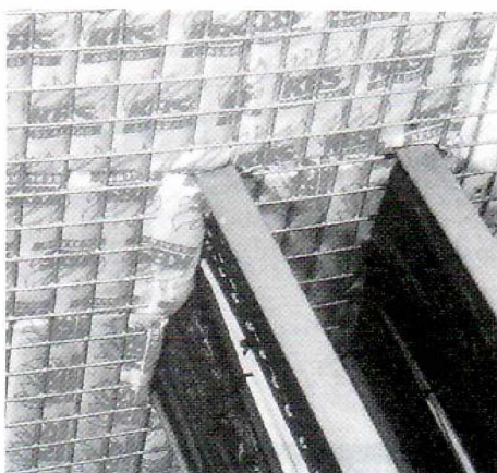
LANZ Sealbags in Wandabschottung

Die LANZ Sealbag Brandschutzkissen werden nach dem Kabeleinzug gleichmässig oder im Verbund geschichtet in die Aussparung eingelegt und ausgedrückt. Sie können ganzflächig oder gefaltet und kombiniert aus verschiedenen Typengrössen platziert werden. Hohlräume sind zu vermeiden, da nur dann feuer- und rauchgasdichte Abschottungen gewährleistet sind. Die Schottdicke beträgt für S 30 mindestens 20 cm, für S 90 mindestens 35 cm. Fragen Sie LANZ bei Unklarheiten an!